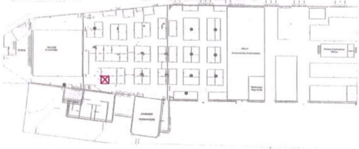
Plan du centre-expo de Nevers

Le stand d'Ouroux (coché en rouge sur le plan) se situait en angle, en face d'une entrée du centre-expo, et juste à côté de l'espace réservé à « Playmobil », c'est-à-dire sur le passage obligatoire des familles avec enfants.