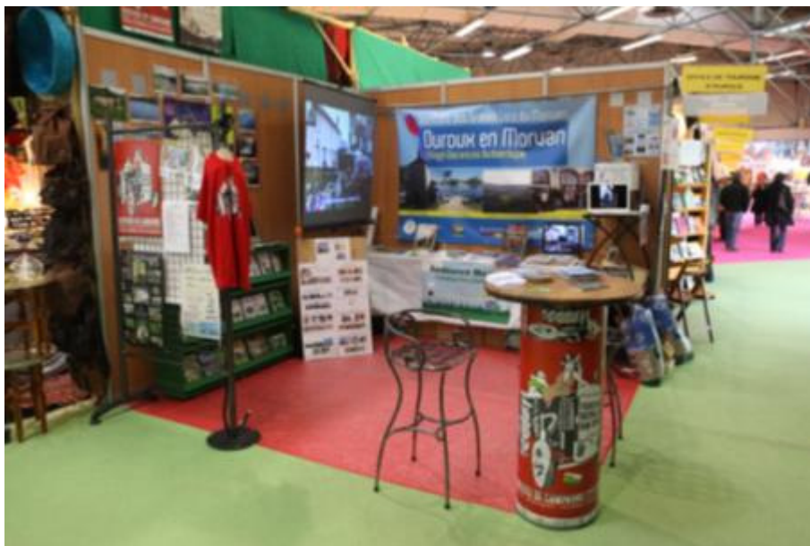
Photo du stand d'Ouroux

L'OT et l'ACAO ont travaillé ensemble à la mise en place du stand d'Ouroux .